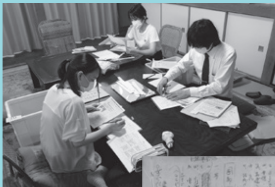
▲文学館での所蔵資料調査の様子